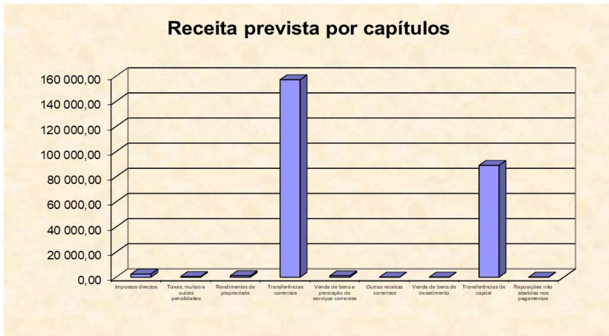
Gráfico n.º 1