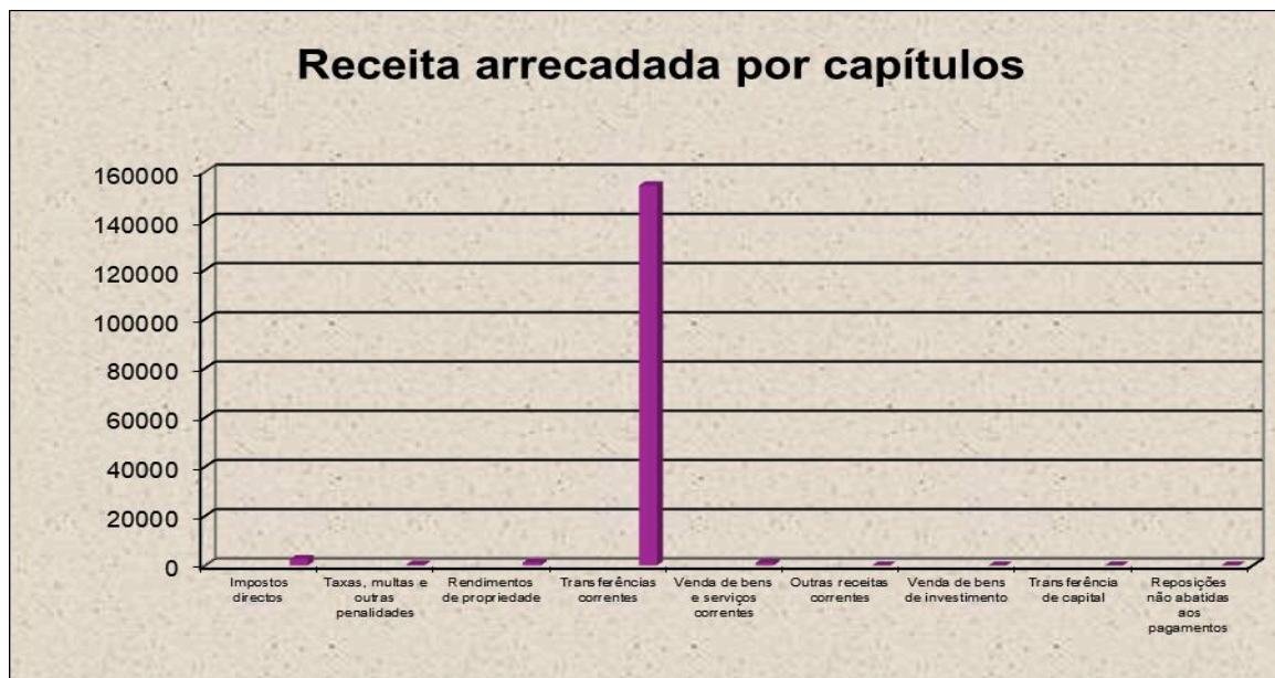
Gráfico n.º 1