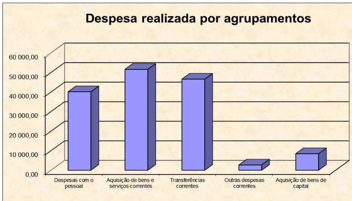
Gráfico n.º 2